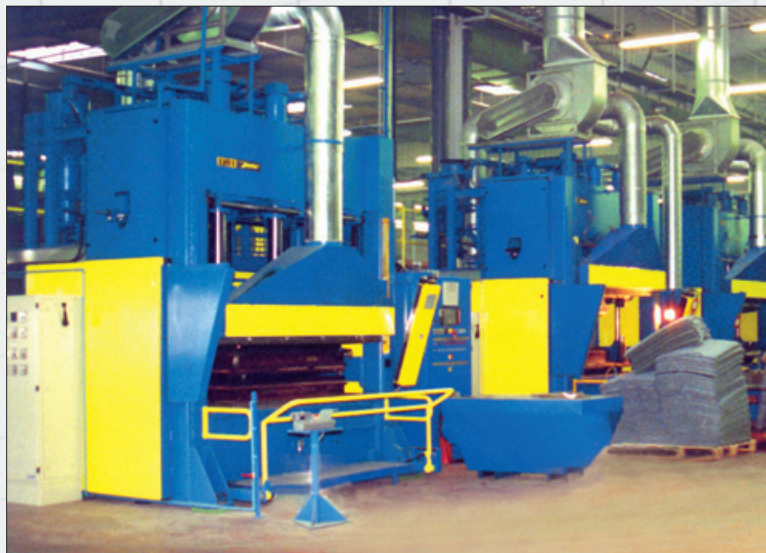
Joos-Qualitäts-Pressen HPS 250/OK in der Produktion von Verkleidungen, Hutablagen und Mittelkonsolen für die Automobilindustrie.

Sehr häufig werden wichtige Komponenten der Ausstattung